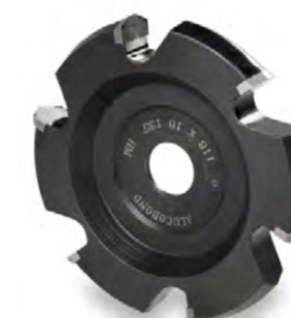
FRESA PARA ALUCOBOND