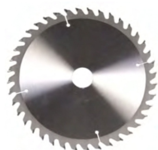
LÂMINA DE MADEIRA

As superfícies de fechamento traseiras garantem uma grande superfície de apoio.