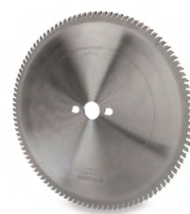
LÂMINA PARA ALUMÍNIO